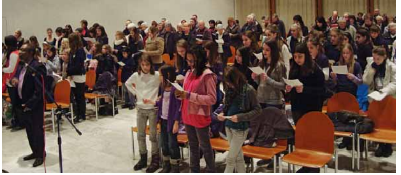
Volles Haus und begeisterter Gesang: «Es esch en Chraft in eus, e Riese-Chraft!»