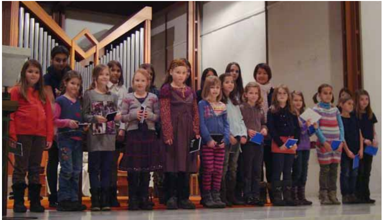
Freude für die Blauring-Schar: Zwanzig Mädchen konnten neu in diesen attraktiven Jugendverein aufgenommen werden. Sie freuen sich auf jedes Gruppentreffen und schon heute auf das zweiwöchige Zeltlager im Sommer.