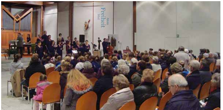
Stimmicher und mitreissend: ganz vorne der noch junge Chor «Spirit of Joy». Er wird am 2. Dezember sein erstes Äbiker Konzert geben.