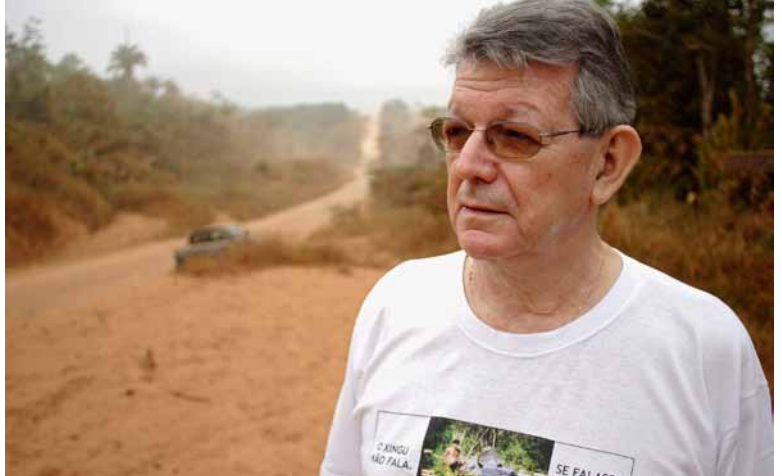
Geht das? Bischof Krätzler kämpft gegen Staudämme in Brasilien. (kreuzgang.org)

Die Rede von Papst Benedikt XVI. am 25. September 2011 vor Bischöfen und Priestern in Freiburg im Breisgau hat die alte Frage von Anpassung und Distanzierung der Kirche gegenüber der Welt neu aufgeworfen. Sein Plädoyer für eine Entweltlichung der Kirche gründet der Papst auf eine doppelte Kritik: der Kirche und der Welt.