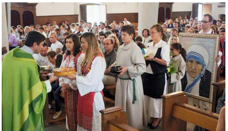
Verehrte Mutter Teresa: Messe zum Tag der albanischen Heiligen.

Ich könnte mir gemeinsame Jugendtreffen vorstellen und fände auch eine gemeinsame Wallfahrt ins Flüeli zu Bruder Klaus sehr schön. In Pristina bauen wir eine Kirche zu Ehren von Mutter Teresa. Die Pfarrei St. Michael und andere Schweizer Pfarreien unterstützen dieses Projekt. Es wäre ein Traum, gemeinsam dorthin zu reisen und so Brücken zu bauen.