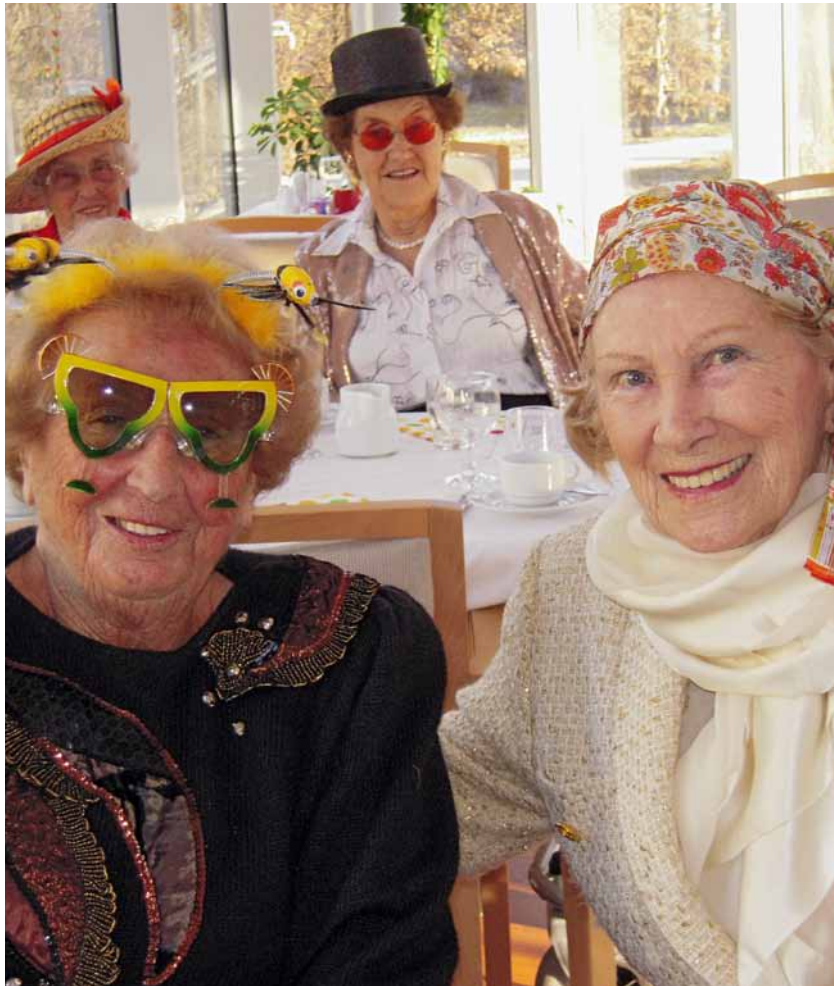
Lachen hält jung und ist keine Frage des Alters.

Jesus warf den Menschen einfache Sprüche an den Kopf. Er verwendete pikante Worte und Bilder. Bei ihm gehen Reiche durch ein Nadelöhr, sind Erste plötzlich Letzte und Splitter in Nachbars Auge werden mit dem Balken im eigenen Auge verglichen. Der Prophet Jeremia träumt sogar von