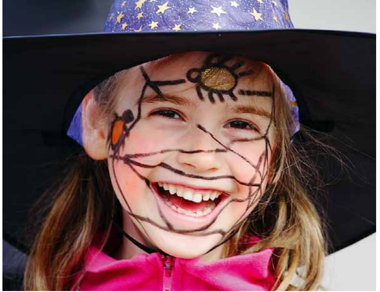
Lachen tut not, auch und gerade mitten im Ernst.

In diesen Tagen werden in den Kirchen lustige Predigten den sonst so seriösen liturgischen Kalender auflockern. Lachen ist in den Gottesdiensten erlaubt. Sonst gibt es ja in der Kirche meistens nicht viel zu lachen. In der Bibel scheint Lachen ebenso wenig hohe Priorität zu haben. Da lacht im Buch Genesis etwa die betagte Sara, als sie von ihrer Schwangerschaft erfährt. Wohl eher aus Verlegenheit kichert sie in sich hinein (vgl. Genesis 18,12). Dass Menschen ausgelacht werden, kommt in der Bibel häufiger vor als das Lachen vor Freude. Im Evangelium wird sogar Jesus ausgelacht, weil er behauptet, die Tochter des Synagogenvorstehers sei nicht tot, sondern sie schlafe nur (vgl. Mk 5,40). Auch da: eine ernste Angelegenheit.